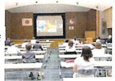
参集・オンライン併用の研修